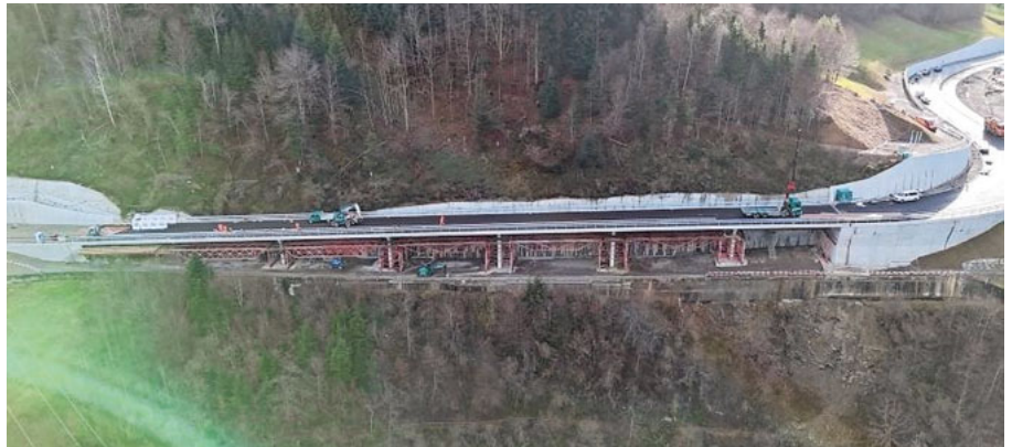
Drohenaufnahme der Bauarbeiten von Anfang Januar.

Am Samstag, 15. März, wird die neue Rängglochstrasse mit einem Fest eröffnet. Alle sind herzlich eingeladen, an der Veranstaltung teilzunehmen. Am Mittag wird das Ränggloch offiziell mit der ersten Busfahrt für geladene Gäste eröffnet. Im Anschluss kann der neue Strassenabschnitt zu Fuss, mit dem Velo oder auf Rollschuhen er-