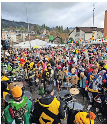
Fasnachtstreiben auf dem Dorfplatz.

Bars: Diverse Bars, Kafizelt mit Ländlermusik. Eintritt ab 16 Jahren, Ü30: Gratisentritt.