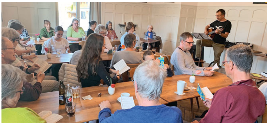
Singen sorgt für Glücksmomente.

3. Februar, 19. März, 14. April, 5. Mai, 2. Juni, 25. August, 15. September, 13. Oktober, 10. November, 1. Dezember. (Judith Reinert)