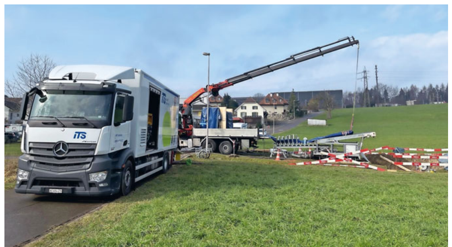
Die Firma ITS bei Kanalsanierungen – hier in einer anderen Gemeinde.

Malters führt in verschiedenen Gebieten in der Gemeinde Kanalsanierungsmassnahmen durch: Im Feld (Luzernstrasse bis Im Feld), Luegete/Geissbühl (Frohofstrasse–Urmisweg–Rainli–Luegetenstrasse–Luegetenmatte–Kirchrain) und Weihermatte (Weihermatteweg–Weiherweg–Birkenweg) werden Kanalreinigungen, grabenlose Kanalsanierungen, Schachtumbauten und Schachtsanierungen vorgenommen. Die Arbeiten sind witterungsabhängig und sollen bis voraussichtlich März 2025 dauern. (swe)