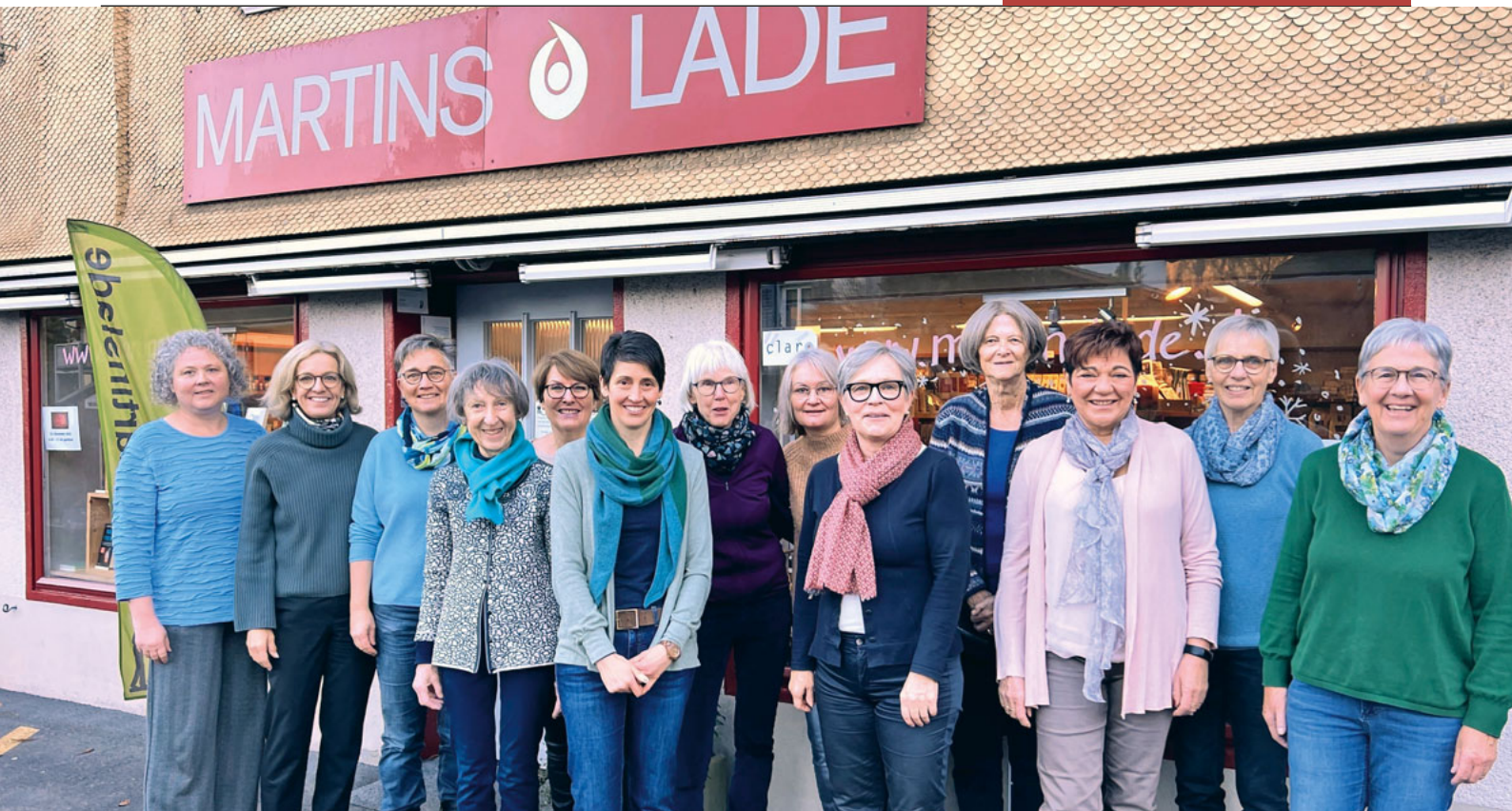
Das Ladenteam des Martinsladens.