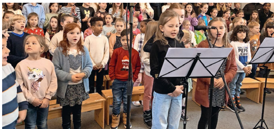
Mutige Gesangssolistinnen.

Die Aufführung war ein voller Erfolg und ein schönes Beispiel dafür, wie die Zusammenarbeit von Volksschule und Musikschule grossartige Projekte entstehen lässt. Sie wird noch lange als besonderer Moment der Weihnachtszeit in Erinnerung bleiben. (Judith Reinert)