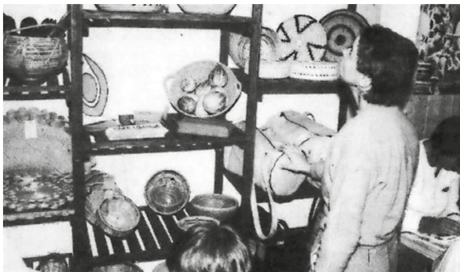
Ein breites und attraktives Angebot erwartet die Kunden.

Mit ihrer Überzeugung, dass sich der Einsatz für eine gerechtere Welt lohnt, gelang es immer wieder, Frauen und Männer für die Mitarbeit zu gewinnen. So stehen heute 13 engagierte, über-