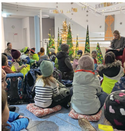
Gespannt lauschen die Lernenden der Geschichte.