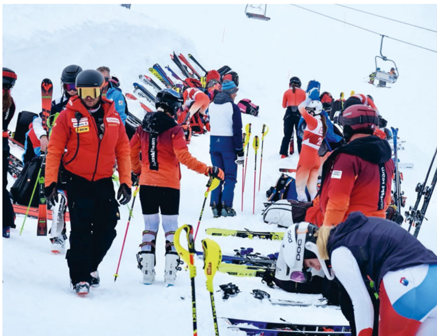
Zahlreiche junge Nachwuchstalente des Schweizer Skirennsports.

Dass es trotzdem weitergeht, freut uns besonders und ist für den Zentralschwei-