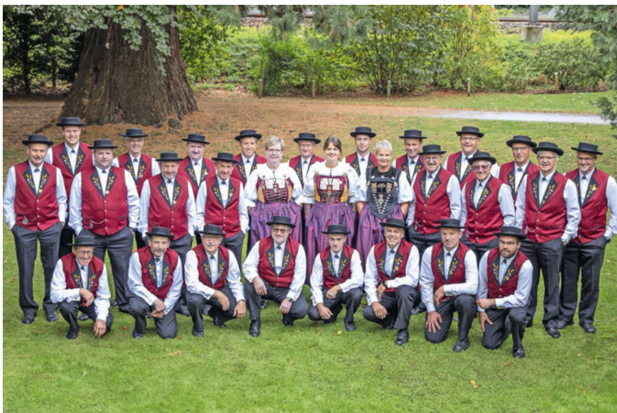
Jodlerklub Blatten.

Das diesjährige Motto «Bsonderi Momänt» zieht sich von der liebevoll gestalteten Dekoration bis zu den sorgfältig ausgewählten Liedern wie ein roter Faden durch das unterhaltsame Programm. Ein Programm, das nicht nur durch Gesang, sondern auch mit Humor überzeugt. Wer in den Gemeindesaal