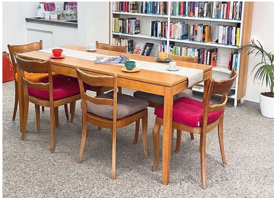
Neu können Besucherinnen und Besucher am Kafi-Tisch verweilen.