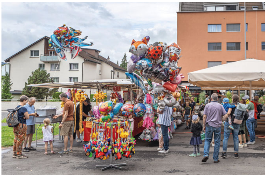
Auf dem Dorfplatz finden diverse Veranstaltungen statt.

Damit hat der Gemeinderat eine Lösung bestätigt, die bereits für das Jahr 2024 temporär beschlossen wurde und die Gebühren für kommerzielle Anlässe