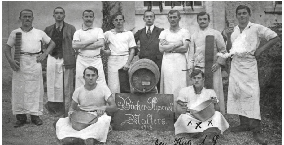
Das Bäckerpersonal im Jahr 1918.

Als wir vom Turmclub die historischen Bilder und Erzählungen dem anschliessenden Rundgang durch das neue Backhaus gegenüberstellten, war der Zeitsprung sichtlich spürbar. Die