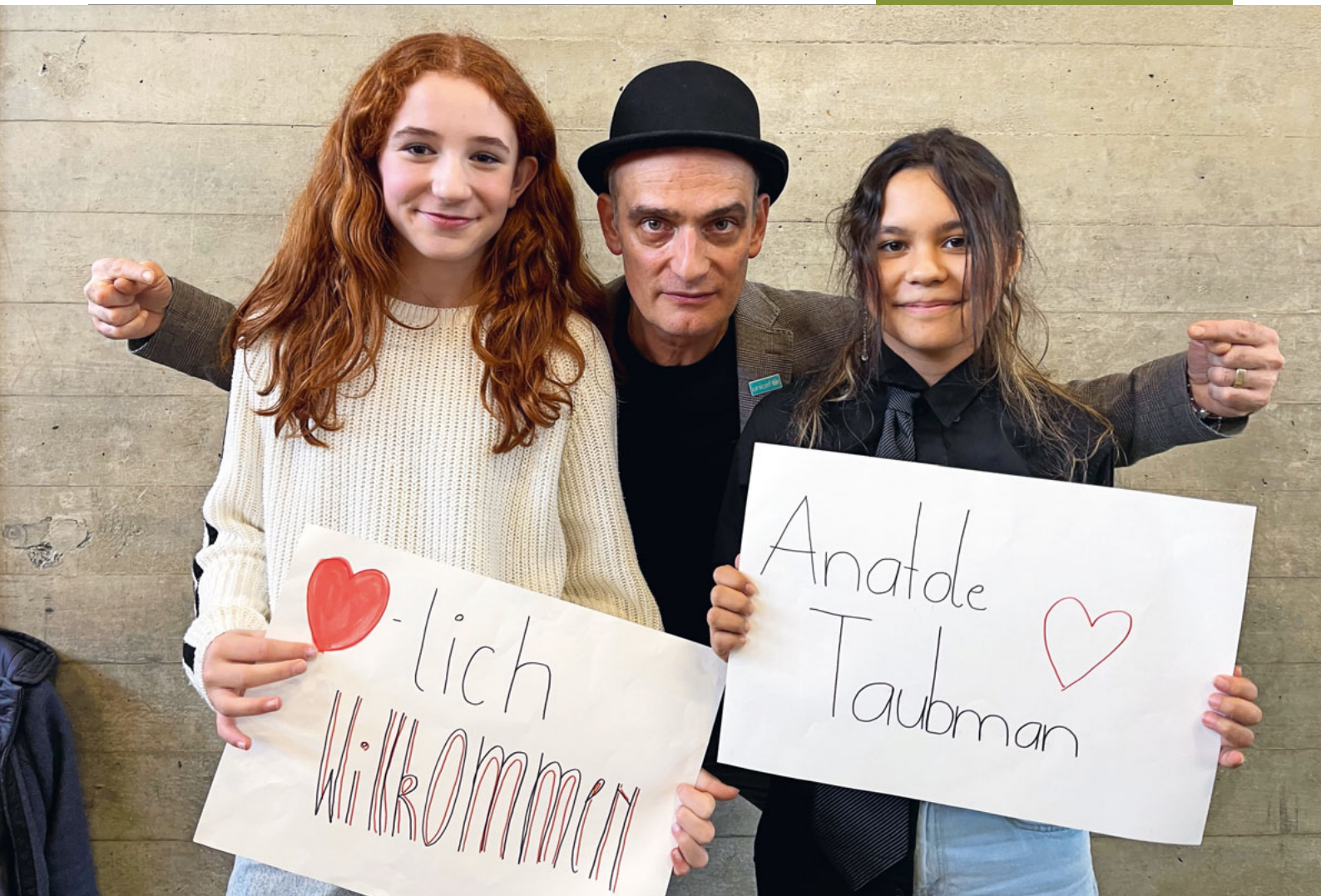
Ein beliebtes Fotosujet: Anatole Taubman und Fans.