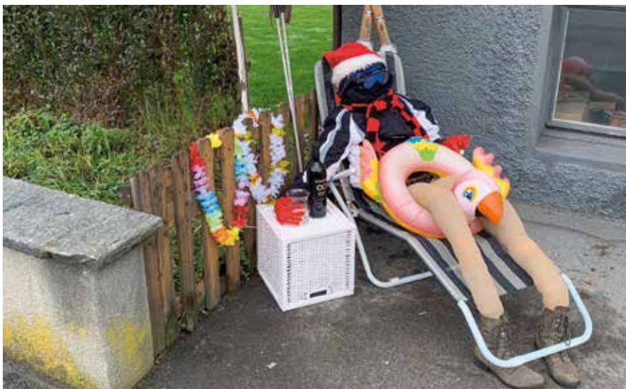
Ein Stopfi hat es sich auf dem Liegestuhl bequem gemacht.

Wir bitten euch, unter Angabe von Namen und Vornamen sowie Adresse und Telefonnummer eine Fotografie des Stopfis an eine der folgenden Adressen zu senden: per E-Mail an info@motteri.ch oder per SMS/WhatsApp an Telefon 079 710 79 89. Eine Bauanleitung findet ihr unter www.motteri.ch .