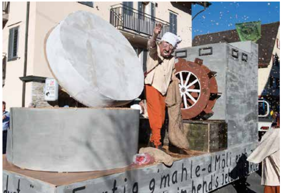
Auf fantasievolle Umzugswagen müssen wir heuer verzichten.

Um einen «Umzug» in der Fasnachtszeitung zu gestalten, hat der Motterirat die Malterser Vereine, die üblicherweise treu einen Wagen gebastelt haben, angefragt, ob sie für diesmal einen «Wagen» auf je einer halben Seite im «Malterser Motteri» bildlich kreieren würden. Die Anfrage ist auf ein sehr gutes Echo gestossen. Selbstverständlich werden auch die Malterser Guuggenmusigen nicht fehlen, deren Schränzen man ohne Probleme unter einem QR-Code in der Zeitung hören wird. Damit alle Malterserinnen und Malterser diesen digitalen Umzug geniessen können, wird der Motterirat die Fasnachtszeitung am 13. Februar 2021 an alle Haushaltungen