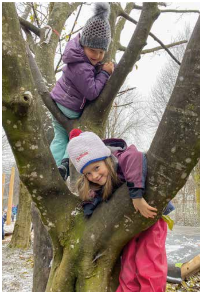
Trotz Nässe und Kälte erkunden die Kinder die Kletterbäume.