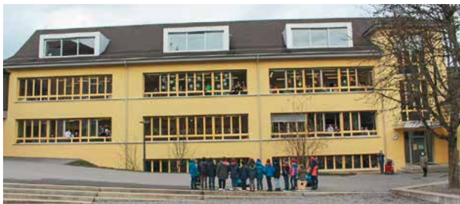
Die Fenster des Schulhauses sind weihnachtlich dekoriert.

sikklassen eine passende Liedauswahl getroffen und coronakonform draussen und in der Eingangshalle des Bü1 aufgeführt.