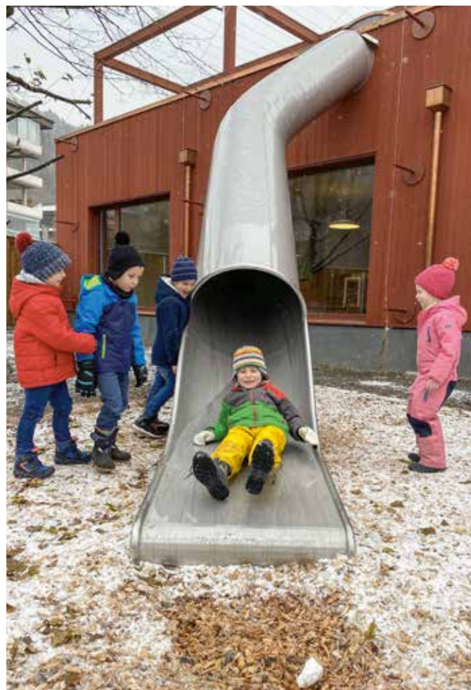
Ein Highlight in den Pausen: die grosse Rutsche.