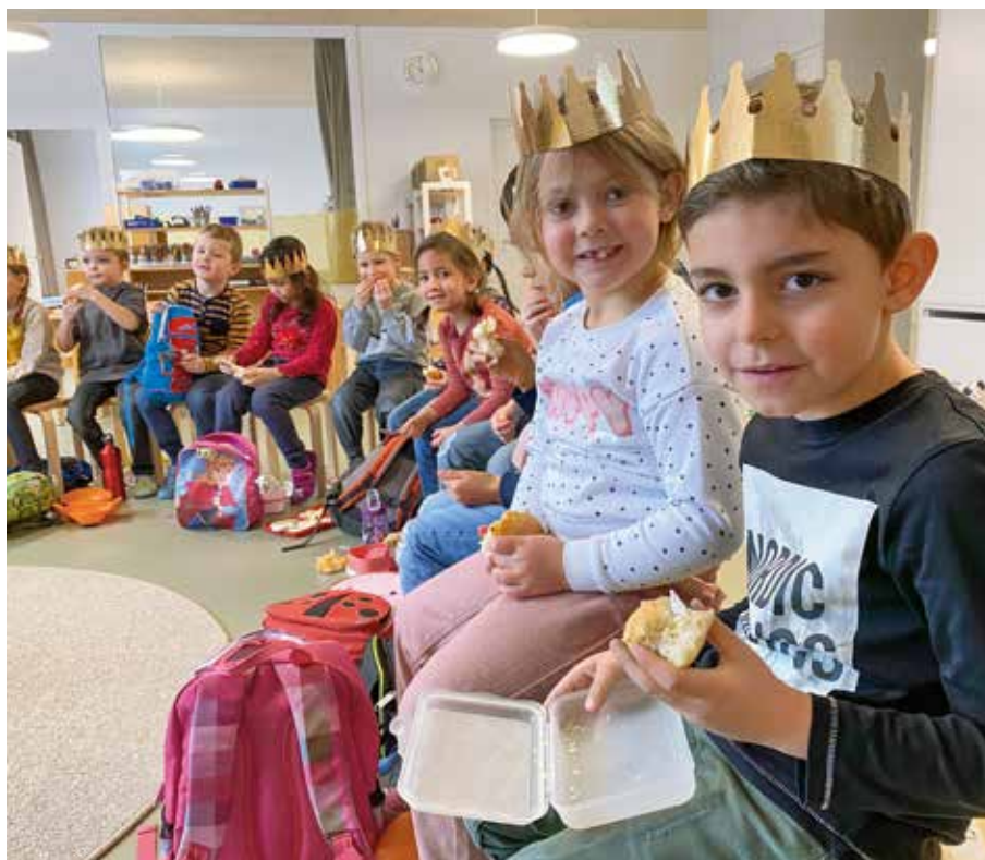
Mit einem schmackhaften Znüni – sozusagen einem königlichen Empfang – wurden die Kinder im neuen Kindergarten Eischachen verwöhnt.

Nach ein paar Schnupperbesuchen im alten Jahr konnten die meisten der Kindergärtler es kaum erwarten, endlich hier in den Kindergarten gehen zu dürfen. Nach einer intensiven Umzugsphase weg vom Kindergarten Zwingstrasse leisteten die Lehrpersonen während der unterrichtsfreien Weihnachtstage unzählige Arbeitsstunden, um den Kindergarten für die Kinderschar ansprechend her- und einzurichten. Neben den Räumen waren die Kinder besonders neugierig darauf, in den Pausen den Aussenspielplatz zu erkunden. So konnte sie auch die bis-sige Januarkälte nicht davon abhalten, auf der Schaukel das Gleichgewicht zu suchen, erste Besteigungsversuche am Kletterbaum zu wagen oder gar die ganze Pause hindurch immer und immer wieder auf der grossen Rutsche von der Terrasse hinunterzusausen.