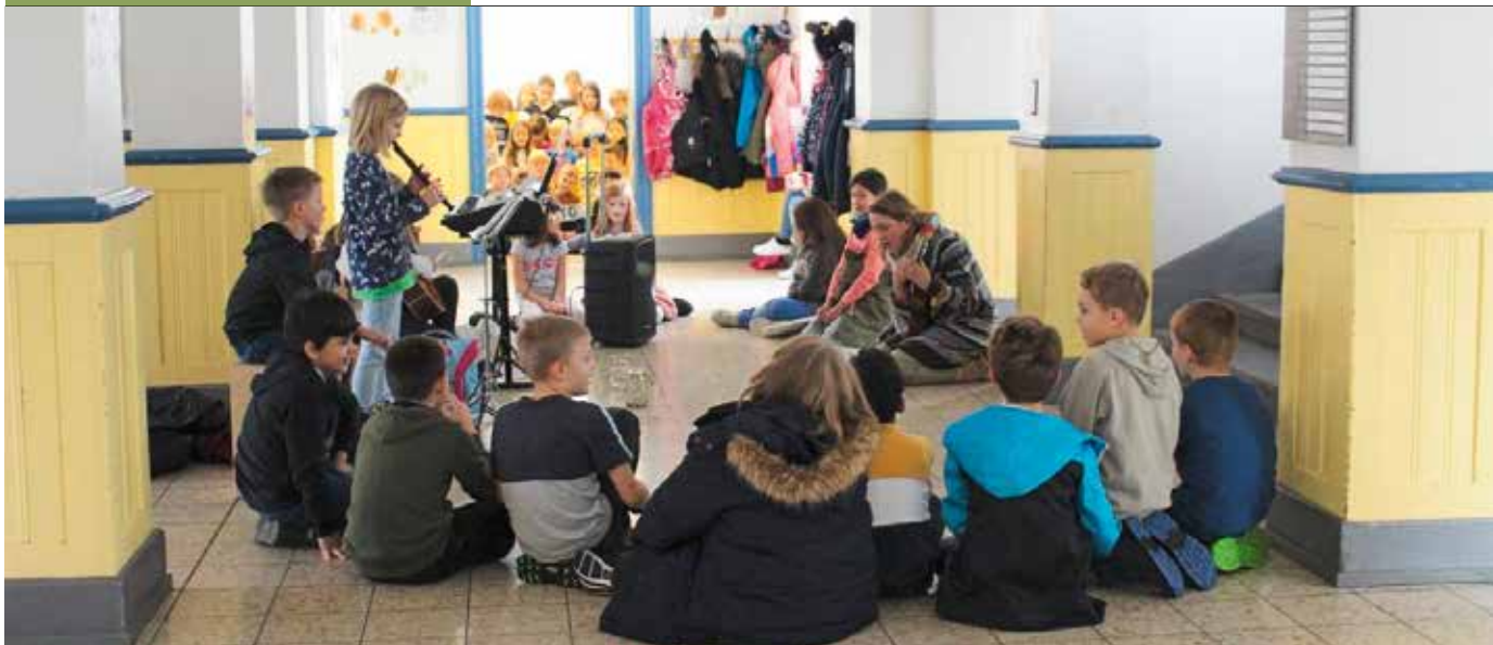
Beim Adventssingen beim Schulhauseingang.